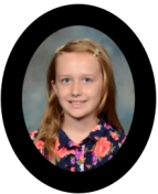
Maizy Nov 30